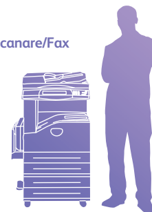
WorkCentre 5230 cu modulul adițional cu două tăvi