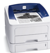
Phaser 3250 cu Tava 2 opțională