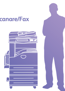
WorkCentre 5222 cu modulul adițional cu două tăvi